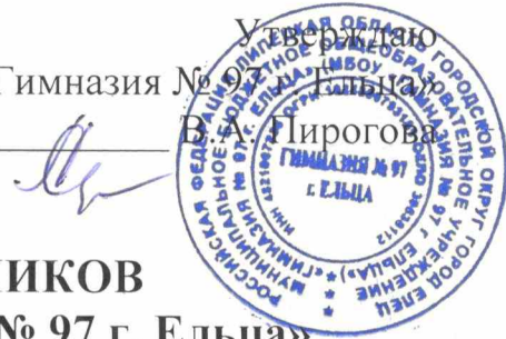
ГРАФИК СДАЧИ И ПОЛУЧЕНИЯ УЧЕБНИКОВ ОБУЧАЮЩИМИСЯ МБОУ «Гимназия № 97 г. Ельца»