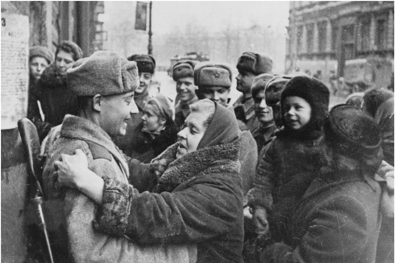
Ленинградцы и красноармейцы у приказа войскам Ленинградского фронта о снятии блокады города, январь 1944 года.