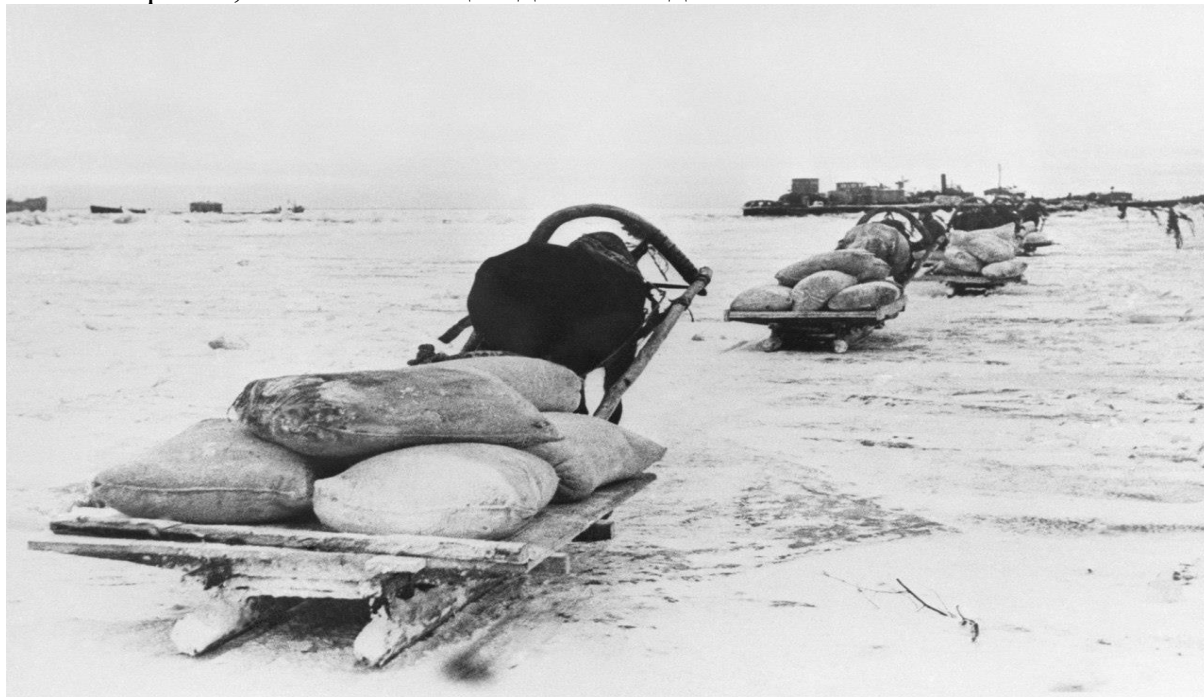
Первый санный обоз отправляется в блокадный Ленинград по льду Ладожского озера.

Утром 12 января 1943 года навстречу друг другу началось наступление войск Волховского и Ленинградского фронтов. Их отделял 15-километровый коридор шлиссельбургско-синявинского выступа (между городом Мга и Ладожским озером), замыкавший кольцо блокады Ленинграда с суши. Наступление поддерживали часть сил Балтийского флота, а также авиация дальнего действия.