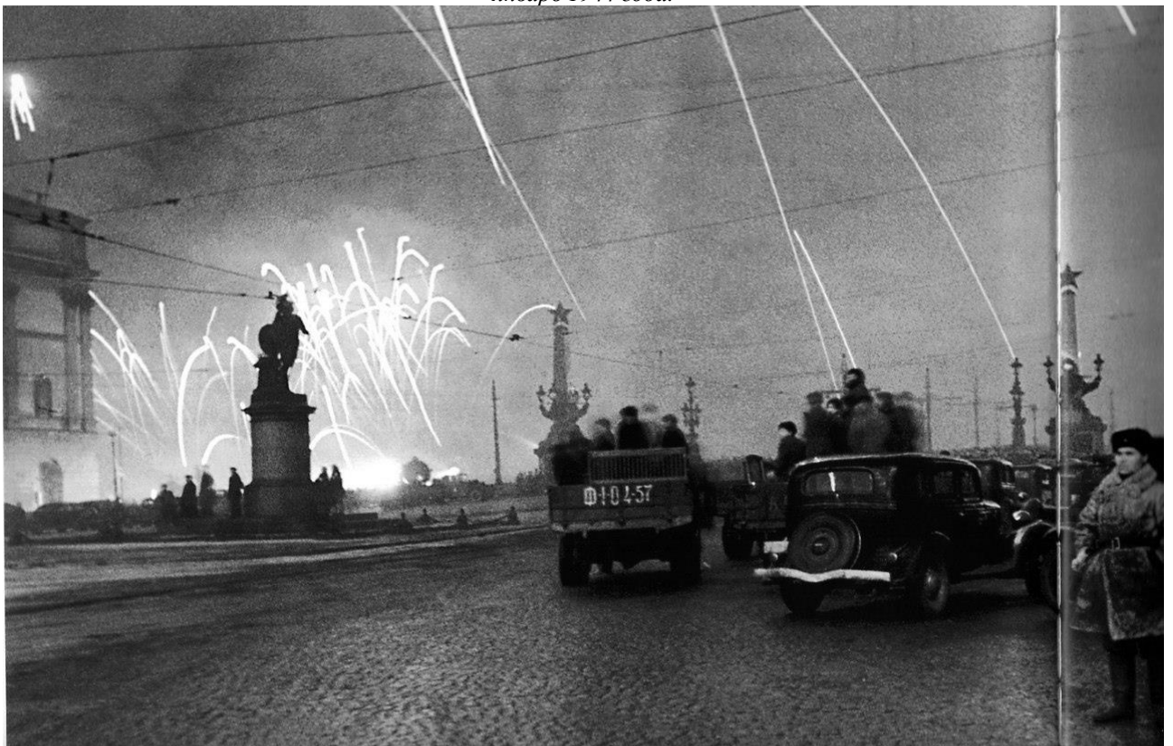
Ленинградцы на Суворовской площади смотрят салют в ознаменование снятия блокады. 27 января 1944 года.

В честь полного снятия блокады Ленинграда 27 января 1944 года в городе был дан праздничный салют. День 27 января, согласно Федеральному закону от 13 марта 1995 года «О днях воинской славы и памятных датах России», является днем